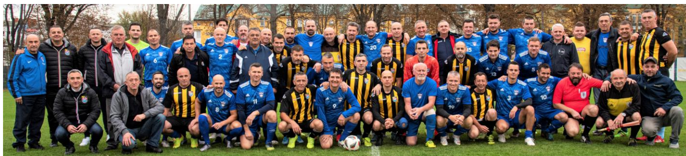
Zajednička fotografija Vukovarski veterani (Vukovar) i Reprezentacija veterana Zagrebačkog nogometnog saveza (Zagreb) Zagreb, 5. studenoga 2022. godine, igralište Nogometnog kluba Vrapče