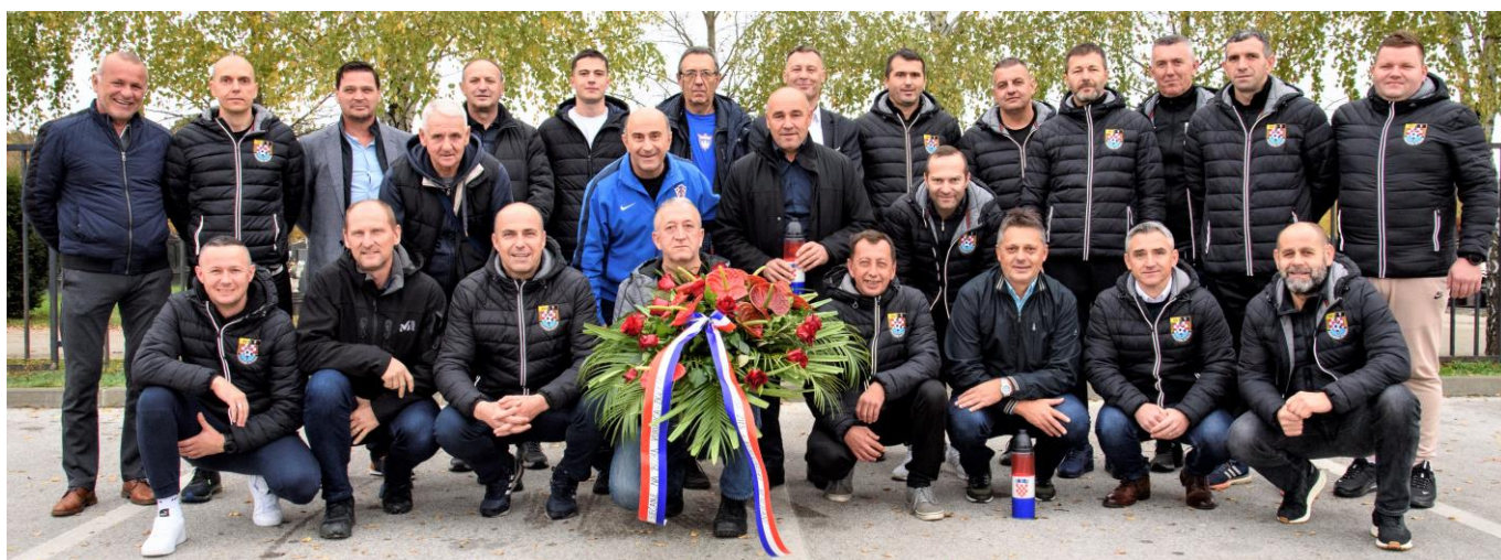
Izaslanstva Ministarstva hrvatskih branitelja, Vukovarskih veterana, Komisije veterana ZNS, Komisije nogometnih sudaca ZNS Groblje Markovo polje, 5. studenoga 2022. godine